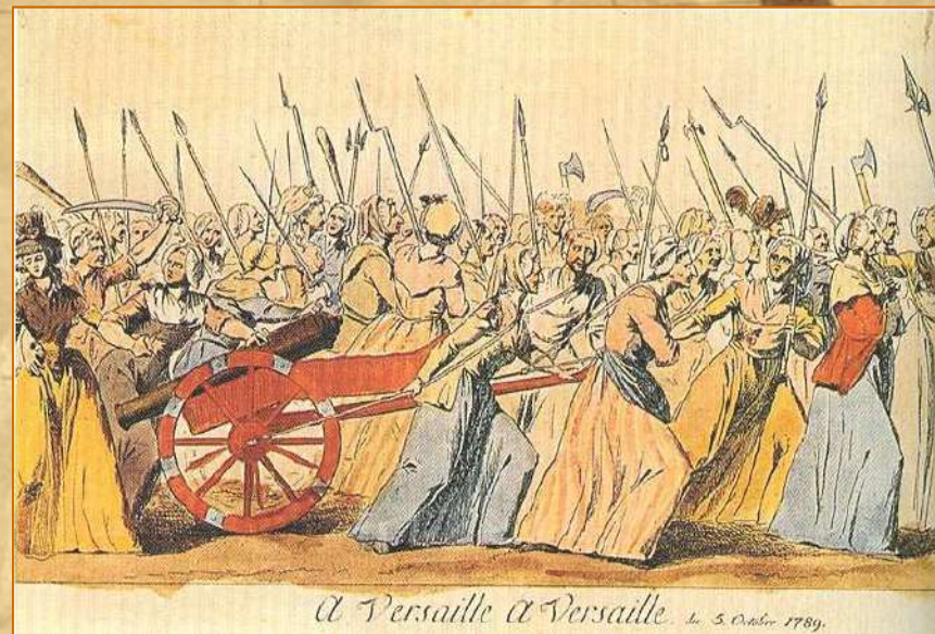
à Versailles à Versailles le 5 Octobre 1789.

Costretto dalla protesta della folla, Luigi XVI è costretto a firmare il documento.