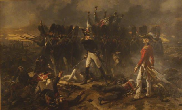
Napoleone sconfitto a Waterloo.

Quindi è un disastro, si ha una nuova coalizione di potenze europee. Napoleone è sconfitto prima a Lipsia, poi a Waterloo.