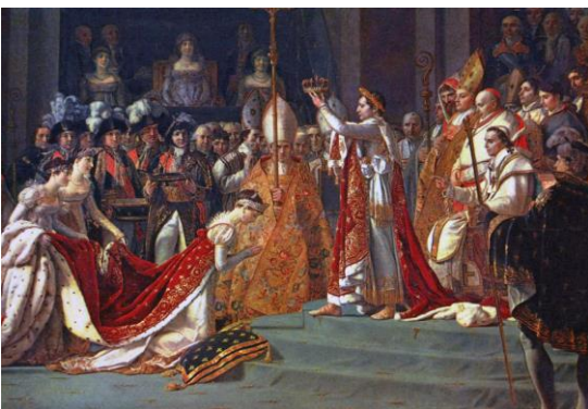
Napoleone incoronato Imperatore.

Nel 1804 si fa incoronare imperatore dei Francesi. L'anno dopo diventa re d'Italia, quindi tutto questo va proprio contro i principi perché Napoleone rappresenta veramente la persona che avrebbe aiutato e avrebbe appoggiato gli uomini che credono nella libertà. Perciò farsi incoronare imperatore aumenta la delusione nei suoi confronti.