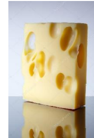
1 morceau de gruyère