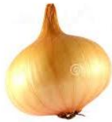
1 livre d'oignon