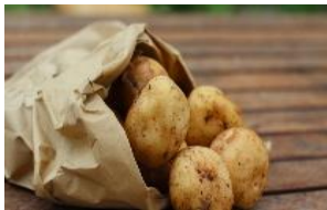
- 1 sac de pommes de terre