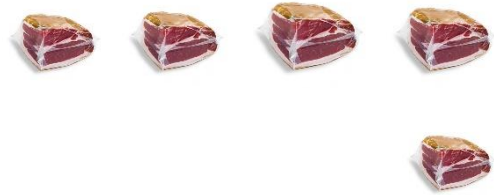
5 tranches de jambons