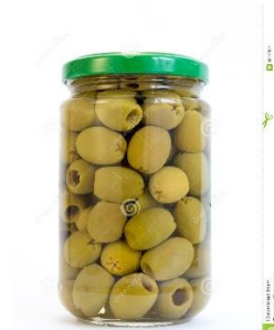
- 1 boîte d'olives en conserve