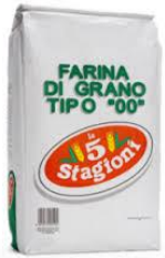
1 kilo de farine