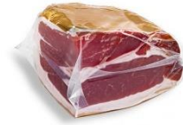
1 tranche de jambon