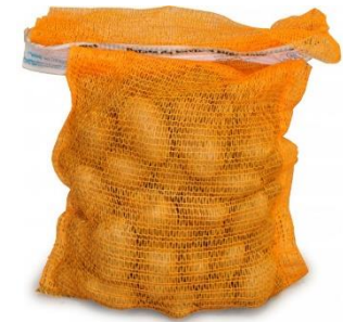
1 sac de 5 kilos de pommes de terre