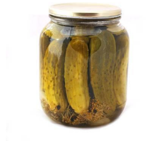
- 1 pot de comichons