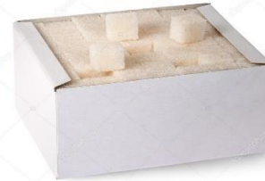
1 kilo de sucre en morceaux