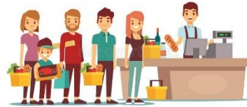
faire la queue