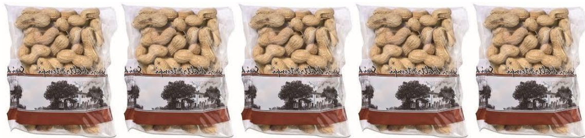
5 sachets de cacahuètes