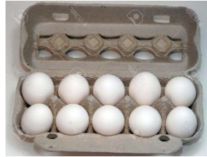
1 douzaine d'oeufs (oeuf si pronuncia oe, oeufs si pronuncia oef)