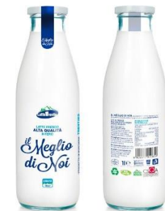
5 litres de lait