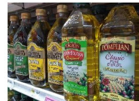
1 bouteille d'huile