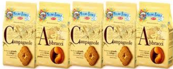
5 paquets de biscuits