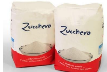
1 kilo de sucre en poudre